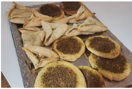
Dies ist ein arabisches Gebäck „Fatayer“